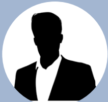
サービス業 40代 経営者

事業計画が枝葉のように繋がっていけば最終的に大切な目的に繋がっていくと分かったので数字だけでなくビジョンもイメージできるようなものにしたい！