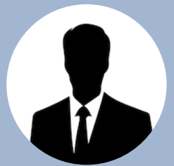
製造業 40代 経営者

今までやってきた目標設定よりも今回の事業計画書の方が分かりやすいと思いました！ 組織の方向性を共有するのにわかりやすく、活用できると思いました！